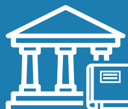
VIDEN OG FORSKNING

Enkel og intelligent overvågning af patienter, som er sengeliggende eller sidder i kørestol