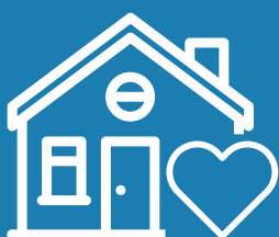
BORGER I EGET HJEM

Vi prioriterer driftssikkerhed og it-sikkerhed meget højt, og har således fået ISAE 3204 it-sikkerhedserklæring.